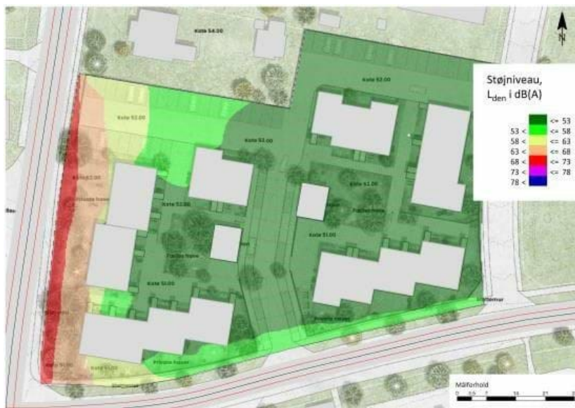
Figur 10 Resultat af støjberegningerne.

Som følge af ovenstående håndteres støjpåvirkningen fra Hillerødvej i facaderne på boligbebyggelsen således at støjen inde i boligerne ikke overstiger Miljøstyrelsens vejledende grænseværdier for boliger. Endvidere skal bygningerne placeres således at opholds- og gangarealer afskærmes mod støj. Boligernes primære opholdsarealer er som følge heraf placeret bag bebyggelsen og eventuelt mellem bebyggelsen og den østlige del af Langkæret/Birkekrogen.