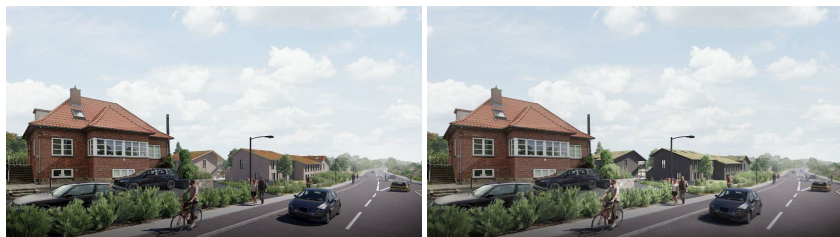
Figur 8, Visualisering som viser et eksempel på beplantning af arealet mellem bebyggelsen og Hillerødvej samt bebyggelsen opført med henholdsvis skifer facade henholdsvis træfacade.