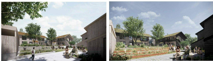
Figur 4 og 5 Illustration af gårdrum og bygninger med henholdsvis træ henholdsvis skiffer facader begge med grønne tage.