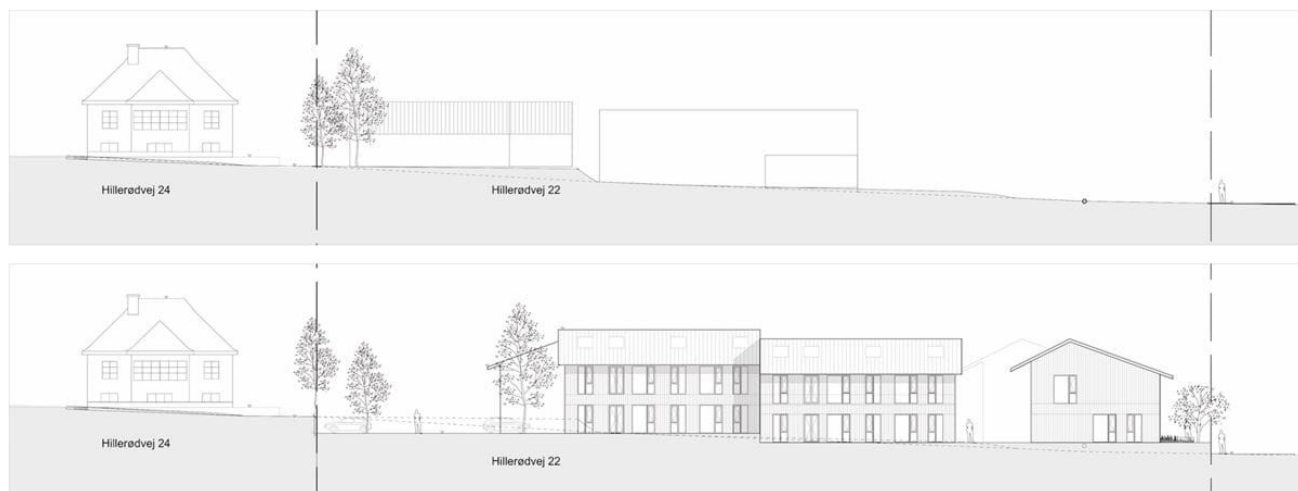
Figur 7 Eksisterende og fremtidigt terræn.

Af figur 7 fremgår et snit, som viser dels hvordan eksisterende terræn og bebyggelse ser ud i dag dels hvordan terrænet kan reguleres og bebyggelsen placeres i overensstemmelse med lokalplanens bestemmelser. Snittet er nord-/sydgående og ligger vest for byggefelt 1, jf. kortbilag 3.