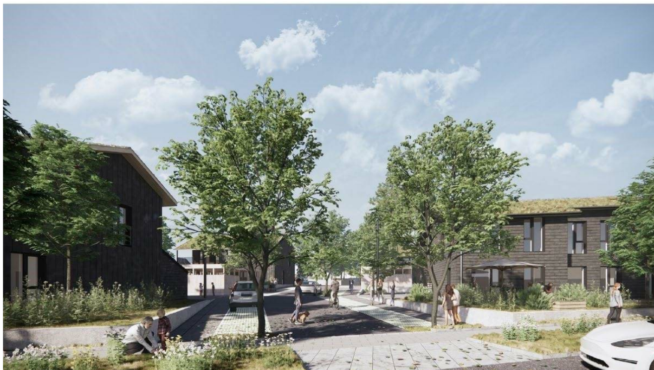
Figur 9 Illustration af ekstempe på ankomst ved overkørslen til Langkæret. Bygningerne har facader af skiffer.

Al beplantning på terræn skal bestå af hjemmehørende og gerne blomstrende arter af dansk proveniens og indrettes med henblik på at øge biodiversiteten i området.